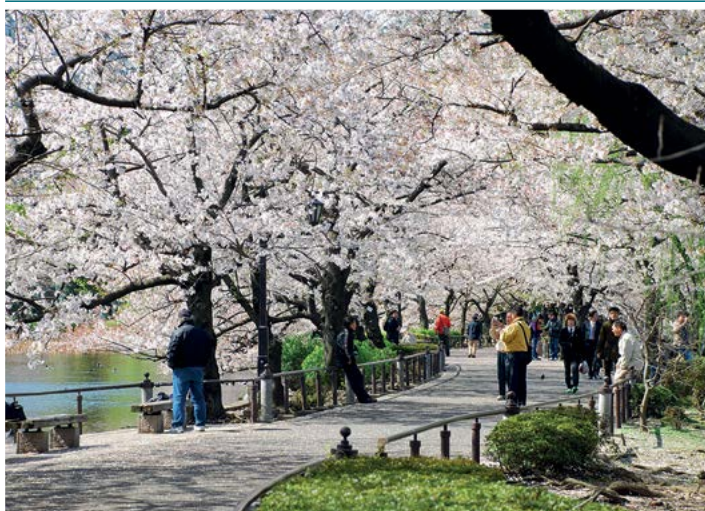
Kwitnące wiśnie przyciągają do Japonii turystów z całego świata

Niski budżet – schronisko młodzieżowe, skromny ryokan lub business hotel .