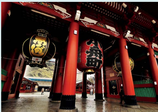
Wejście do świątyni Sensō-ji

WIECZOREM. Aby zaznać całkowitej odmiany atmosfery i zanurzyć się w feerii neonów, należy o zmroku udać się do Akihabara ★, dzielnicy „elektrycznej”. Można też wstąpić na drinka do niezwyklej barów zwanych maid café .