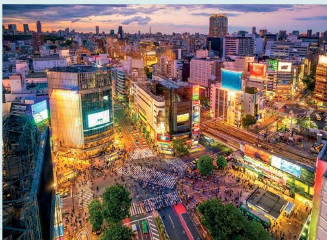
Słynne skrzyżowanie w dzielnicy Shibuya